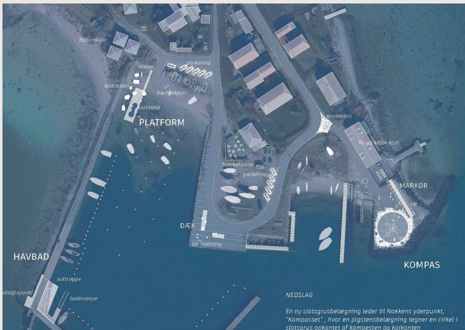
Situationsplan fra vinderforslaget