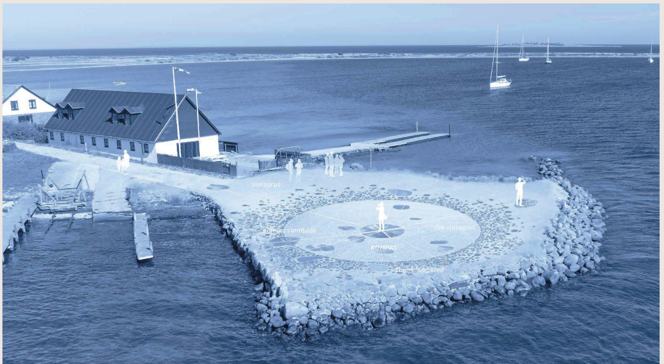
Visualisering fra vinderforslaget